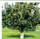
写真：ウトビラーズ・スバトラウバーの樹(スイス)

リンゴ幹細胞エキスは、西洋リンゴ「ウトビラーズ・スバトラウバー」から採取した幹細胞を培養し、ナノカプセルに封入した成分です。このリンゴは古くから知られる品種で、20本しか現存しない絶滅危惧種です。4ヶ月経っても腐らず、長期保存できることが特徴です。リンゴ幹細胞エキスは、ヒト皮膚幹細胞の働きを向上させ、肌老化の根本を予防します。またナノカプセル化することで、肌への浸透力を高めています。